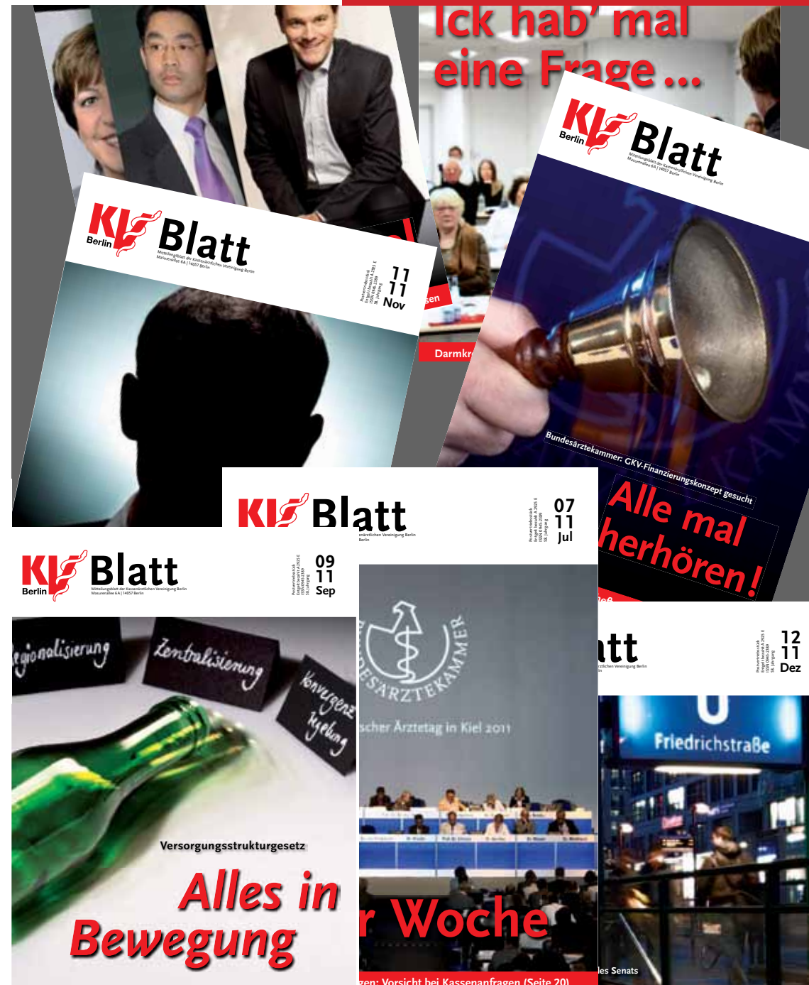
...en: Vorsicht bei Kassenanfragen (Seite 20)